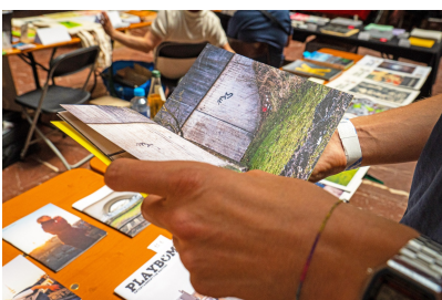
UNLOCK BOOK FAIR